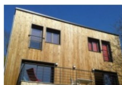
Un système de pilotis pour échapper à une démolition