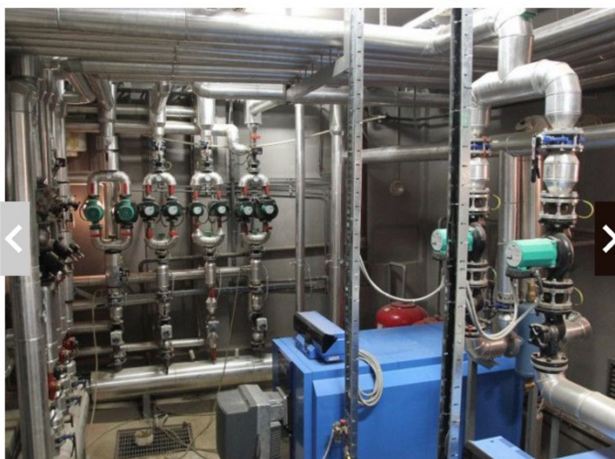
Chaudière de l'Ambassade de France en Serbie