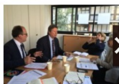
Architectes et constructeurs de maisons : vers un dialogue renoué