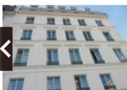
Ravalement de façades à Paris (diaporama)