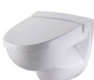
Toilette sous vide Evac 1,2 litres