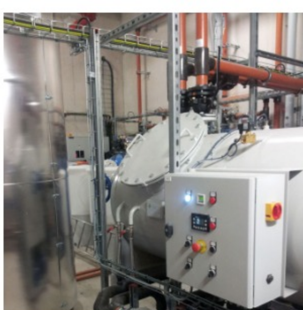
La centrale de vide Evac HQE crée le vide dans le réseau et collecte les eaux usées.